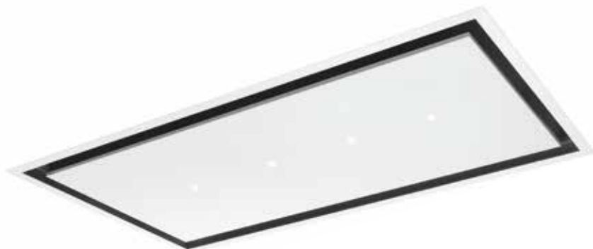
Blanc mat (900 mm)