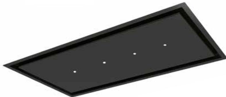
Noir mat (900 mm)