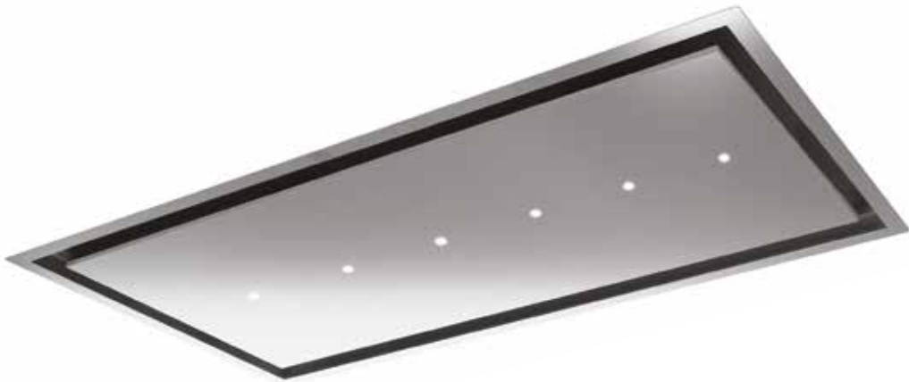
Inox (1200 mm)