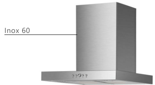
Façade / Cheminée : inox